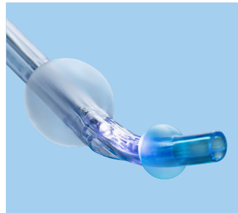
Ambu® VivaSight™ 2 DLT