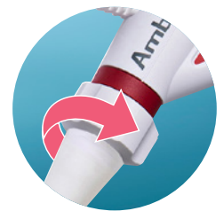
Rotación de 120° a izquierda/derecha