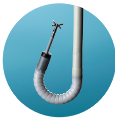
Ángulos de articulación (195°/195°)