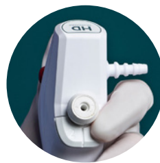
Botones del endoscopio