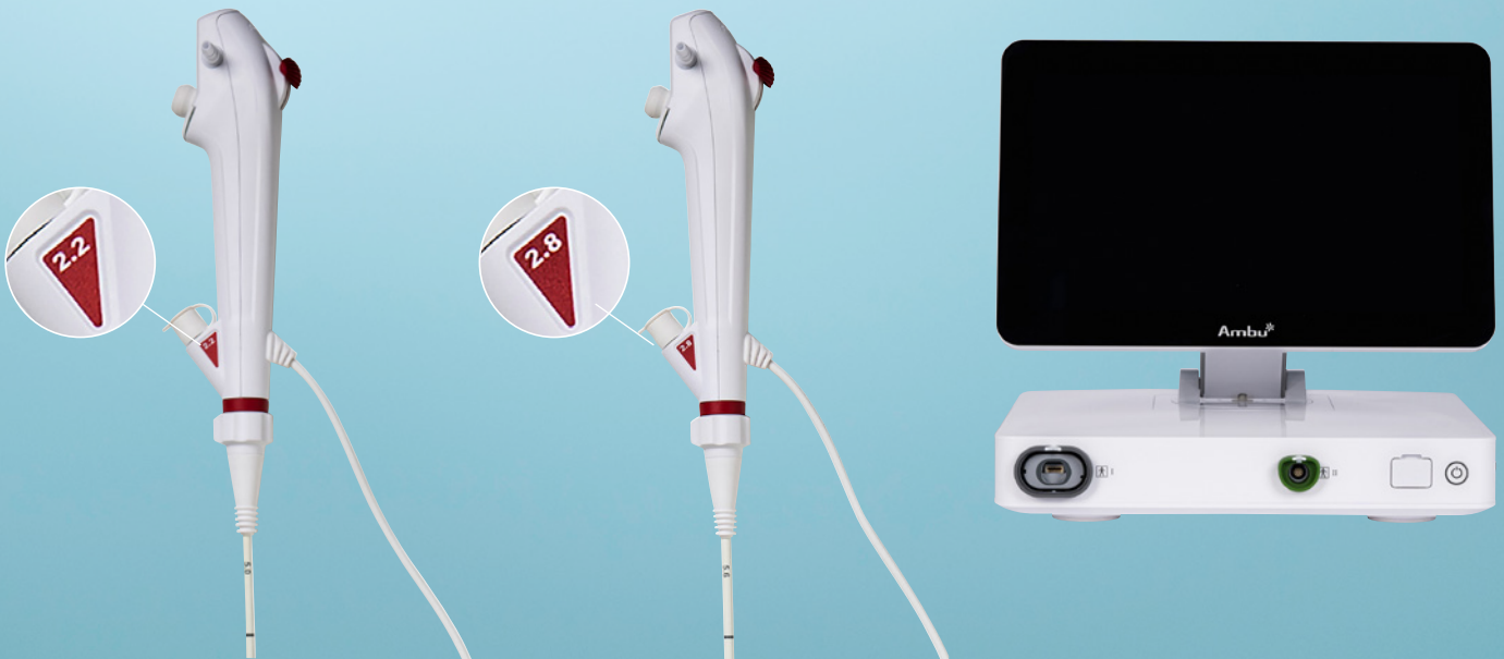
Unidad de visualización y procesamiento Ambu® aBox™ 2