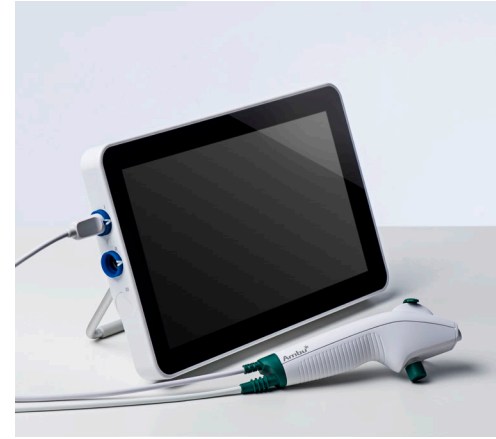
Ambu® aScope™ 4 Broncho Regular y Ambu® aView™ 2 Advance.

* No existe ninguna garantía que indique que la combinación de los accesorios seleccionados sea compatible únicamente en función de la anchura mínima del canal del instrumento.