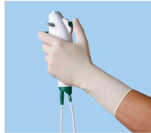
Mango ligero y ergonómico diseñado para ofrecerle un agarre más firme y cómodo.