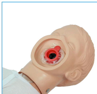
Cabeza de Ambu Junior