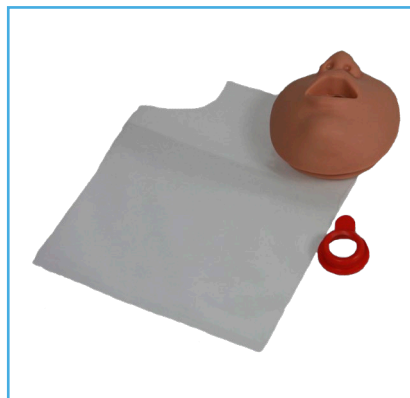
Sistema Higiénico Único de Ambu